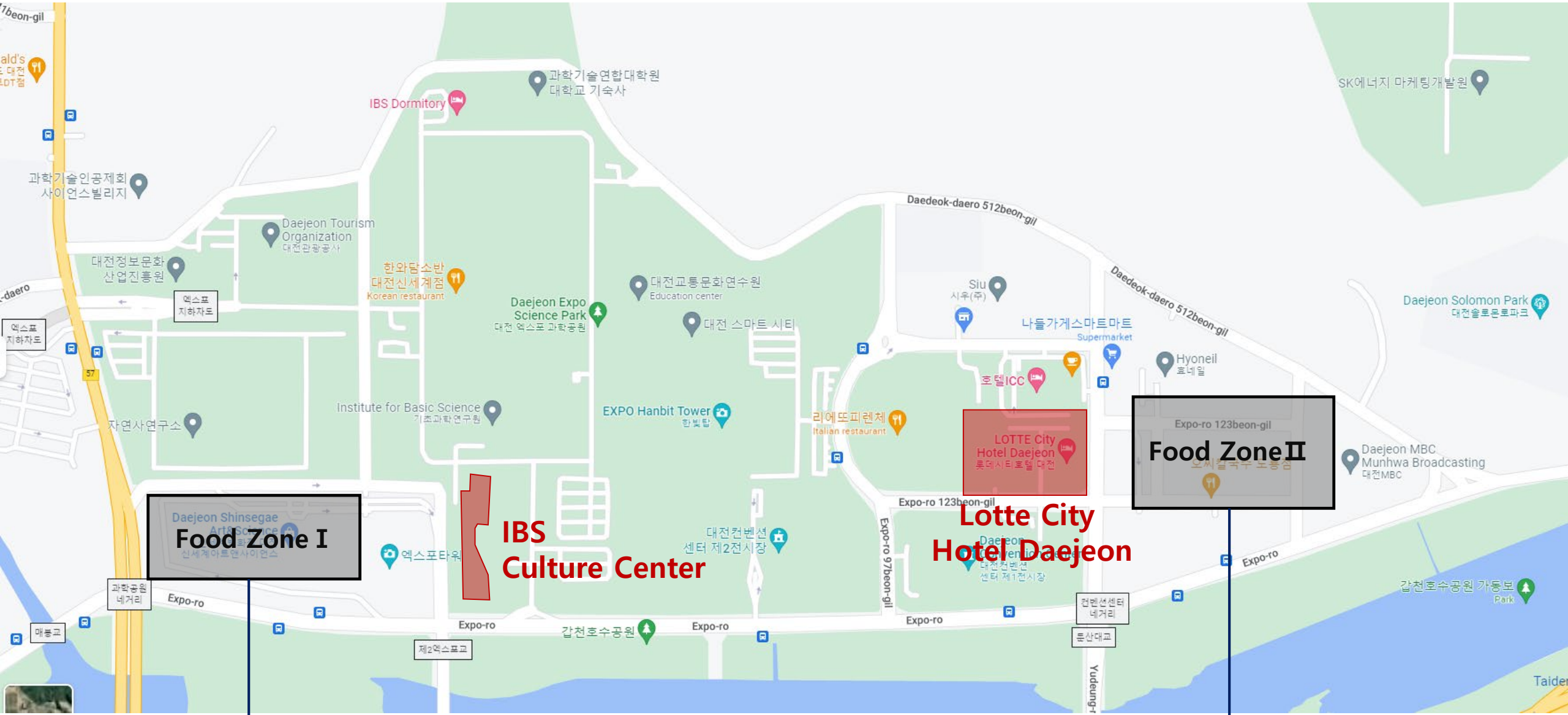
Daejeon Shinsegae Department Store (5minute walk)